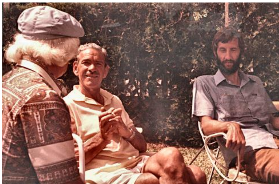
Я (справа), дремлющий на солнце во время беседы двух друзей моих родителей. Испания, 1983 год.

Из этого сложного положения я помог ей выйти, написав книгу об индуистском учении, которое я изучал и практиковал. Мама никогда её не читала, но держала на виду специально для людей. Формулу «Мой сын – миссионер» сменила формула «Мой сын – писатель, живущий и работающий в Индии».